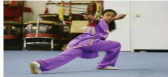
A person in a purple uniform is performing a martial arts move, possibly judo or karate.