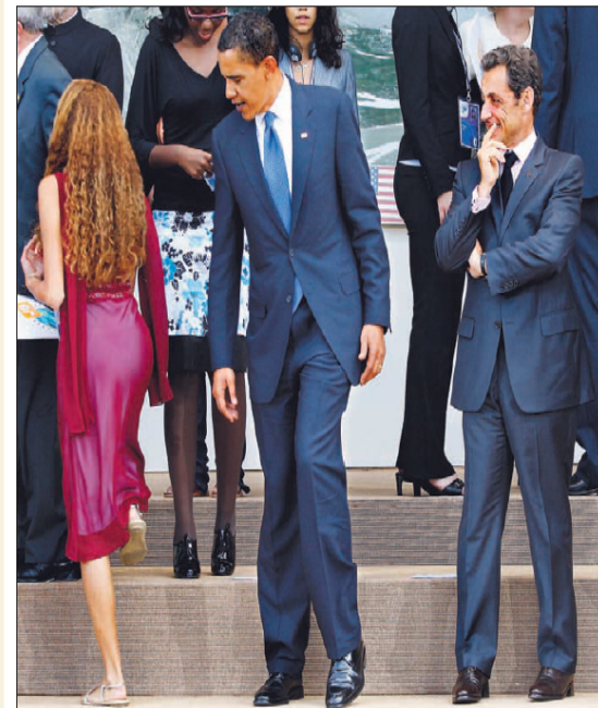
U.S. President Barack Obama and French President Nicolas Sarkozy take their places with junior delegates for a group photo at the G8 summit in Laquila, Italy, yesterday. Leaders of the G8 countries wrap up their meetings today.