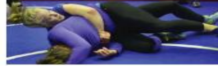
A person in a purple uniform is performing a martial arts move, possibly judo or karate.