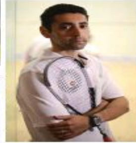
A man in a white shirt is holding a tennis racket, likely a professional player.