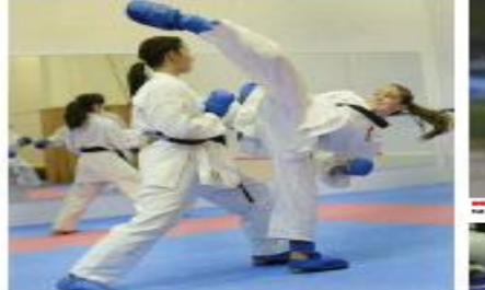
Two athletes in white karate uniforms are sparring on a blue mat during a training session.