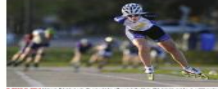
A person in a blue and white uniform is running on a track during a race.