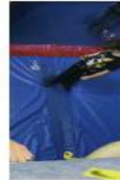
A person in a purple uniform is performing a martial arts move, possibly judo or karate.